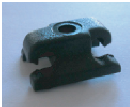
Para postes de madeira